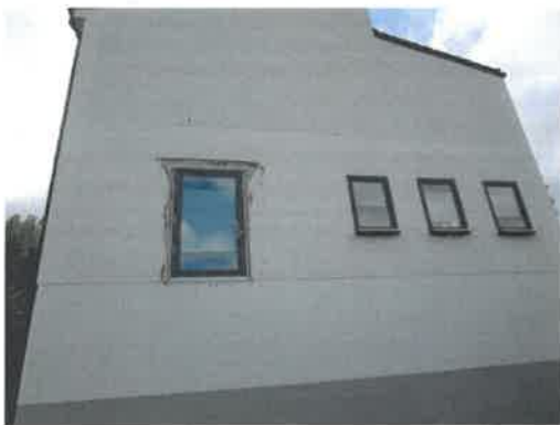
Ostseite: Zusätzliche Ausgänge für 2. Rettungsweg