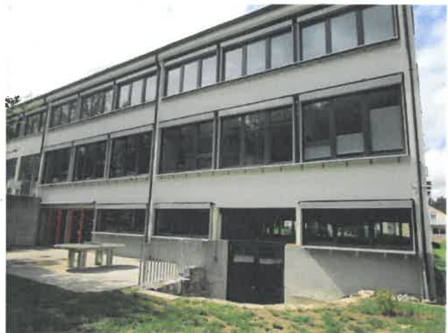
Ausgang UG Bewegungsraum